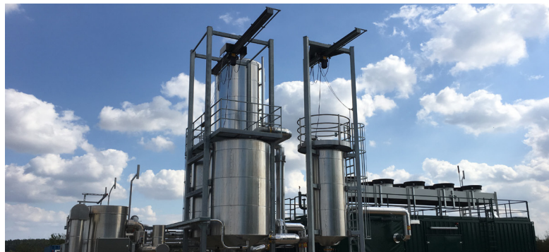
Die Biogasaufbereitungsanlage in Parum (DE) bereitet Rohbiogas für die Einspeisung ins Gasnetz auf.

Obwohl die Kund:innen von naturemade star Biogas die ökologische Energieproduktion direkt finanzieren, wird u.a. die Treibhausgaseinsparung bei importiertem Biogas nicht in der Schweizer Klimabilanz abgebildet. Denn bei den internationalen Klimaabkommen gilt das so genannte Territorialprinzip: demnach werden die vermiedenen Emissionen jenem Land angerechnet, in dem das Biogas erzeugt und Erdgas physisch substituiert wurde. Eine Übertragung von staatlich anerkannten Emissionsrechten und die damit verbundene Anrechenbarkeit der treibhausgas-mindernden Wirkung zwischen der Schweiz und dem Exportland ist derzeit nicht möglich (Stand 2022).